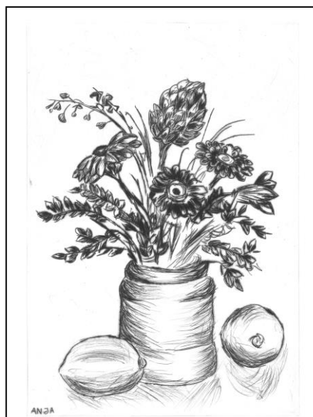
Abb. III: „Blumenstrauß“